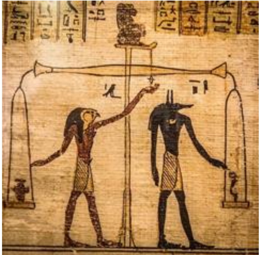
Imagen 1: "Anubis". Ángel Monroy. 2021. Imagen 2: Dios de los muertos egipcio. Detalle del Libro de los Muertos. Tebas. Egipto 1070 a.c.

Les dijo también: "Considerad lo que oís. Con la medida con que medís, será medido para vosotros y os será añadido" Mr. 4:24